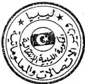
د. أنور أبوبكر الفيتوري وزير الاتصالات والمعلوماتية

يعمل بهذا القرار من تاريخ صدوره، وعلى الجهات المعنية تنفيذه كلاً فيما يخصه .